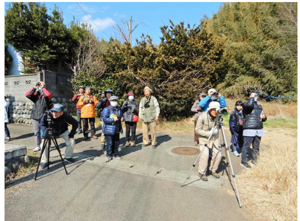
ノスリとモズを観察中