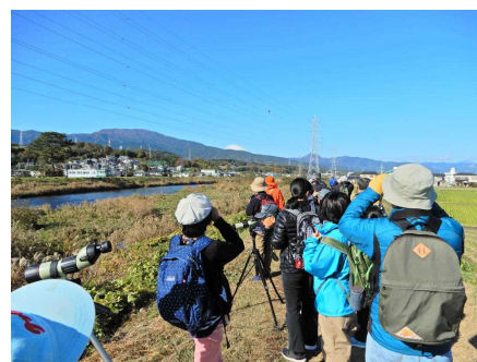
アオサギなどを観察中の参加者