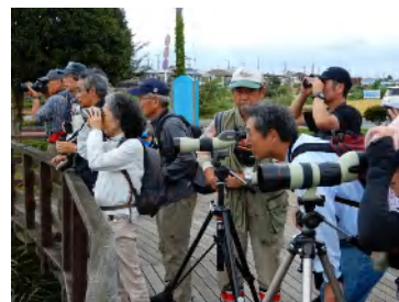
観察風景 (昨年・大根公園)