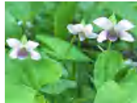
ニョイスミレ（ウズスミレ）