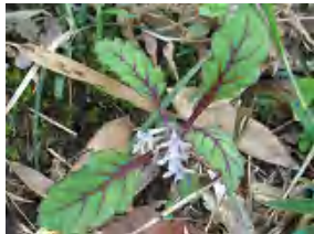
ツクバキンモンソウ