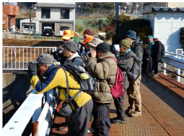
キセキレイを観察中