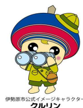
伊勢原市公式イメージキャラクター フルリン

三ノ宮比々多神社から塔ノ山緑地公園とその周辺の里山をめぐり、冬 の 山野の野鳥と里山の原風景を感察 し ます。