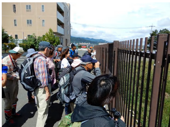
タシギを観察中の参加者(真田調整池にて)

コガモ(エクリプス)、カルガモ、カワセミ、キジバト、バン、タシギ、イソシギ、トビ、 チョウゲンボウ、コサギ、チュウサギ、ダイサギ、アオサギ、ゴイサギ、モズ、ハシボ ソガラス、ツバメ、コシアカツバメ、イワツバメ、ムクドリ、シジュウカラ、スズメ、 ハクセキレイ、セグロセキレイ、キセキレイ、カワラヒワ、ドバト(外来種)