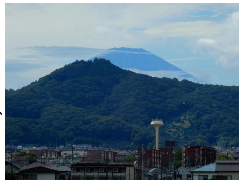
弘法山と富士山(善波川沿いにて)

また、移動中のツバメ科3類の姿も見られ、その特徴を紹介するとともに、イソシギとタシギの2ショット、渡ってきたばかりのコガモなども観察・紹介することができた。