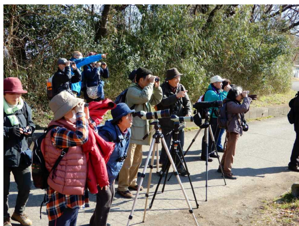
シメやカワラヒワを観察中の参加者

コゲラ、キジバト、トビ、オオタカ、カワウ、ウミウ、モズ、ハシブトガラス、ハシボソガラス、シロハラ、アカハラ、ツグミ、ジョウビタキ、ムクドリ、シジュウカラ、エナガ、ヒヨドリ、メジロ、ウグイス、スズメ、ハクセキレイ、セグロセキレイ、ビンズイ、ホオジロ、カシラダカ、アオジ、カワラヒワ、シメ、ドバト(外来種)