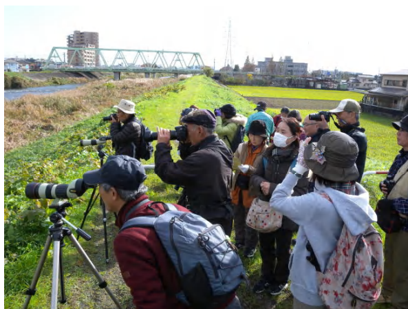
観察中の参加者(蓮正寺橋にて)

マガモ、カルガモ、ヨシガモ、オカヨシガモ、ヒドリガモ、アメリカヒドリ、コゲラ、カワセミ、キジバト、バン、オオバン、イソシギ、タシギ、トビ、オオタカ、チョウゲンボウ、カイツブリ、カワウ、ユリカモメ、ウミネコ、ダイサギ、コサギ、アオサギ、モズ、ハシブトガラス、ハシボソガラス、ツグミ(V)、ジョウビタキ、イソヒヨドリ、ムクドリ、メジロ、ヤマガラ、シジュウカラ、ヒヨドリ、ウグイス(V)、スズメ、ハクセキレイ、セグロセキレイ、キセキレイ、ホオジロ、カワラヒワ、ドバト(外来種)