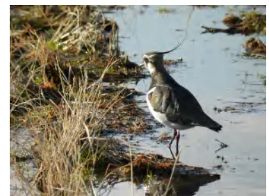
タゲリに会いましょう

※ 雨天の場合 当日〔1月29日〕の午前6時50分頃のNHKの「気象情報」で、神奈川県西部の降水確率が60%以上の場合は、中止します。