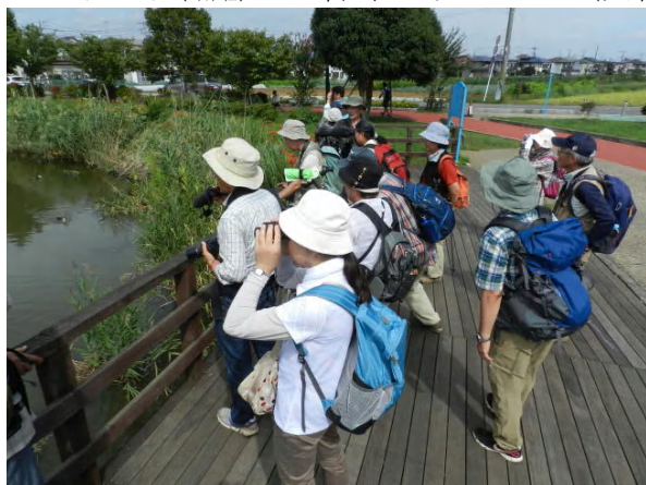
観察中の参加者(大根公園にて)

コガモ(エクリプス)、カルガモ、ヒドリガモ(エクリプス)、カワセミ、キジバト、イソシギ、トビ、チョウゲンボウ、コサギ、チュウサギ、ダイサギ、アオサギ、ヨシゴイ、ゴイサギ、モズ、ハシブトガラス、ハシボソガラス、ツバメ、コシアカツバメ、イワツバメ、ムクドリ、シジュウカラ、ヒヨドリ、スズメ、ハクセキレイ、カワラヒワ、ドバト(外来種) 番外：ヤマカガシ(大根公園調整池と鶴巻排水機場付近)