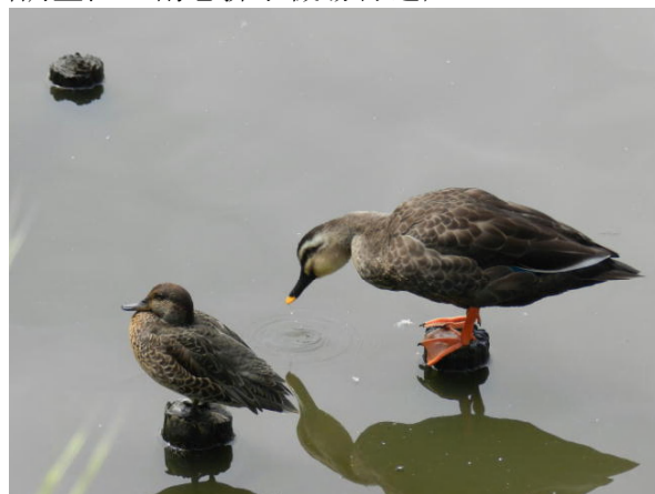
コガモ(エクリプス)とカルガモ