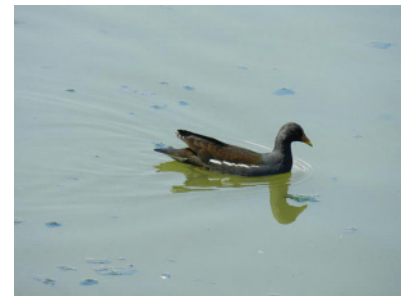
パン (大根公園にて)

4 持ち物 双眼鏡、お弁当、水筒、筆記用具、 雨具、タオルなど {お持ちの方は図鑑やルーペ}