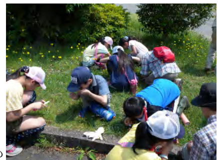
ルーペで花を観察中

〔子どもたちは、毎回、畑の作業や自然観察、自然のものでの工作などを行います。〕 〔スクールで学んだことなどを、ご家庭でも聞いてください。大人も参考になります。〕