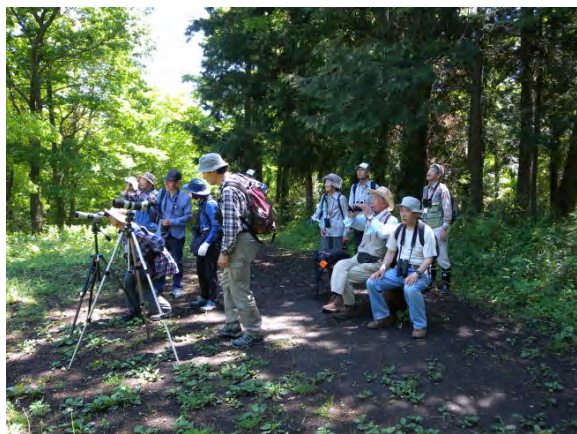
塔の山山頂で観察

コジュケイ、キジ、コゲラ、アオゲラ、トビ、モズ、ハシブトガラス、ハシボソガラス、ツバメ、イワツバメ、キビタキ、ムクドリ、ヤマガラ、シジュウカラ、エナガ、キクイタダキ(群れ)、ヒヨドリ、メジロ、ウグイス、ヒバリ、スズメ、ハクセキレイ、ホオジロ、カワラヒワ、ドバト、ガビチョウ(外来種)