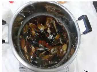
時間がたち葉が変色してきた