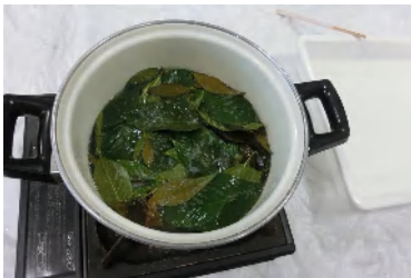
葉を重そうで煮る