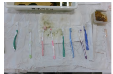
葉脈から葉肉が取れた！